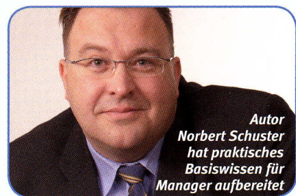
Autor Norbert Schuster hat praktisches Basiswissen für Manager aufbereitet

ein Überblick über nützliche Programme und Erweiterungen zu Twitter gegeben, die vor allem für engagierte Twitterer interessant sein dürften. Zur Vollendung des Ganzen liefert der Autor noch ein kurzes Resümee, um die angebrachten Informationen auf die Key Facts zu reduzieren. Danach kann man sich noch einen praktischen Überblick über bestehende Twitterporträts von Unternehmen verschaffen, sowie über die genauen Daten und Fakten der Twitteruser.